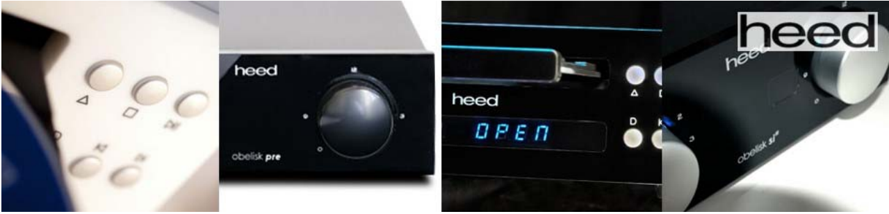
Die Presse über Heed :